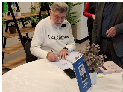
Autor autogramme jagamas

väliskülaline ja mis sundis Matit 1988. aasta novembris kirjutama ülikooli rektorile avaldust: „Palun mind vabastada matemaatikateaduskonna dekaani kohustustest ...“.